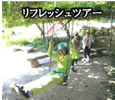
リフレッシュツアー

2012年から生活クラブ長野の組合員のカンパをもとに福島県を訪問してきました（2013年は広島と祝島を訪問）。当初は支援としての思いが強かった現地訪問ですが、その後は福島で実際に活動されている方々との交流が柱となりました。訪問して感じたことを支部に戻って報告するなかで、福島の現状を自分たちの問題として考えるきっかけを与えられました。