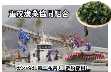
重茂漁業協同組合

震災時の津波で本社工場を含め3工場が全壊し、従業員79名全員が解雇という苦渋の選択となりました。ボランティアによるがれき撤去や、物資やカンパの支援を受けて2013年7月には新工場での製造を再開、組合員カンパを活用して太陽光発電パネルを設置しました。また、高橋徳治商店では2018年3月、野菜加工場を開設し、震災で親を亡くし精神的なダメージを受けた若者らを積極的に採用、支援する活動をしています。