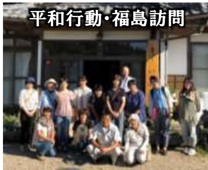
平和行動・福島訪問

生活クラブ長野 の代表的な支援として「平和行動・福島訪問」と「リフレッシュツアー」があり、費用はカンパで賄われています。2020年は感染拡大予防のため開催できませんでしたが、毎年継続して行われている大切な活動です。