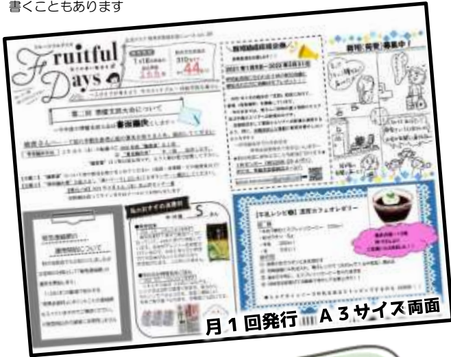
月1回発行 A3サイズ両面

内容決定や大まかな記事作成は三役が担当し、レイアウトを担当の支部委員が行います。各専門委員会の記事は、専門委員会が書くこともあります