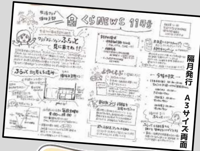
隔月発行 A3サイズ両面

手書きの良さは、親しみやすさや身近な感じですかね。この時代に手書きというだけで結構珍しがられ、目を引くようです。また、手書きだと、多少厳し目の内容や生活クラブに対する熱い思いなど、ストレートに書いても、読み手にソフトに伝えられると思います。