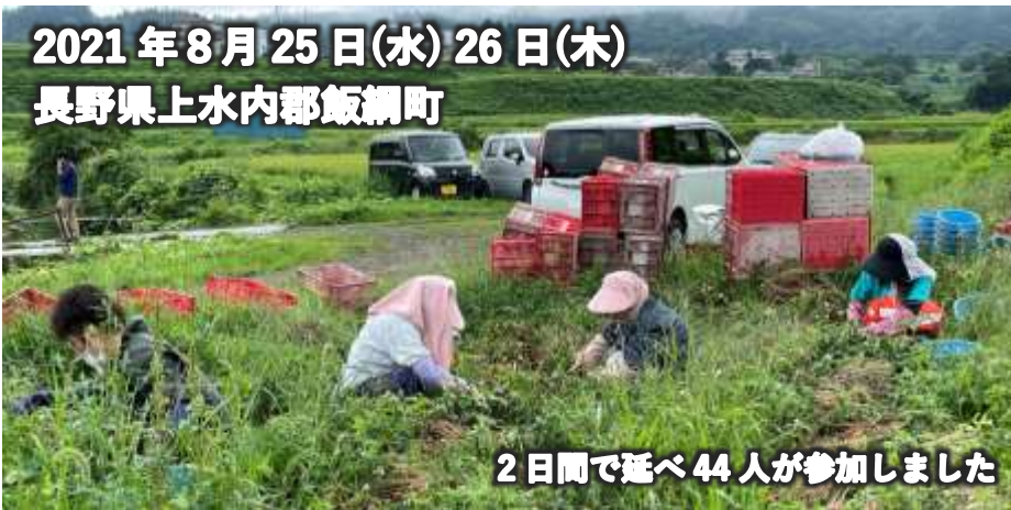
2日間で延べ44人が参加しました

生活クラブでは、トマトジュースの原料となる加工用トマトの生産を、組合員による「計画的労働参加」で支えています。トマトジュースを消費する組合員自身が、「生産者」として深く関わり、その労働を直接担うもので、「援農」といったお手伝いではなく、きちんと労働対価が支払われます。