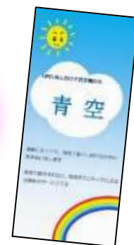
青空リーフレット