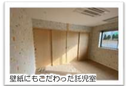
壁紙にもこだわった託児室