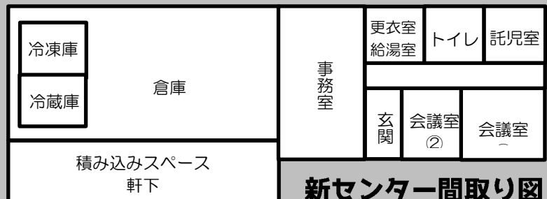
新センター間取り図

上田ブロックは最初に上田支部が結成されたことから始まりました。1984年に上田支部が結成、1986年には組合員1,000人になったのを機に、元スーパーの店舗を改装し開設したのが現上田センターです。