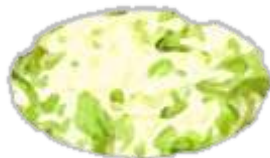
ソース、マヨなどは お好みで

すべての裁量を入れ、 とろーりくらいに溶く。 薄焼きみたいに焼いた ら出来上がり!